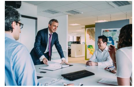
Consultoría y asesoría

Centralizar, depurar y afianzar los datos. Las tecnologías de BI permiten reunir, normalizar y centralizar toda la información de la empresa, mediante un almacén de datos, permitiendo así su explotación sin esfuerzo. De esta forma, los departamentos comercial, operativo y financiero basan las decisiones estratégicas en la misma información.