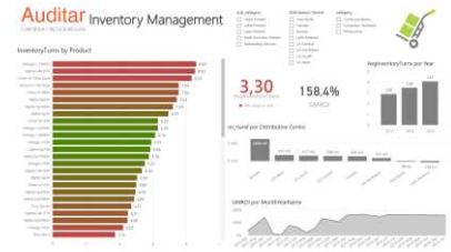
Ej: Control de inventarios

Descubrir información no evidente para las aplicaciones actuales. En el día a día de las aplicaciones de gestión se pueden esconder pautas de comportamiento, tendencias, evoluciones del mercado, cambios en el consumo o en la producción, que resulta prácticamente imposible reconocer sin el software adecuado. Es lo que se puede calificar como extraer información de los datos, y conocimiento de la información.