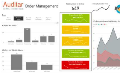
Ej: Order Management

Centralizar, depurar y afianzar los datos. Las tecnologías de BI permiten reunir, normalizar y centralizar toda la información de la empresa, mediante un almacén de datos, permitiendo así su explotación sin esfuerzo. De esta forma, los departamentos comercial, operativo y financiero basan las decisiones estratégicas en la misma información.