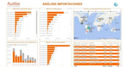
Ej: Análisis de Importaciones